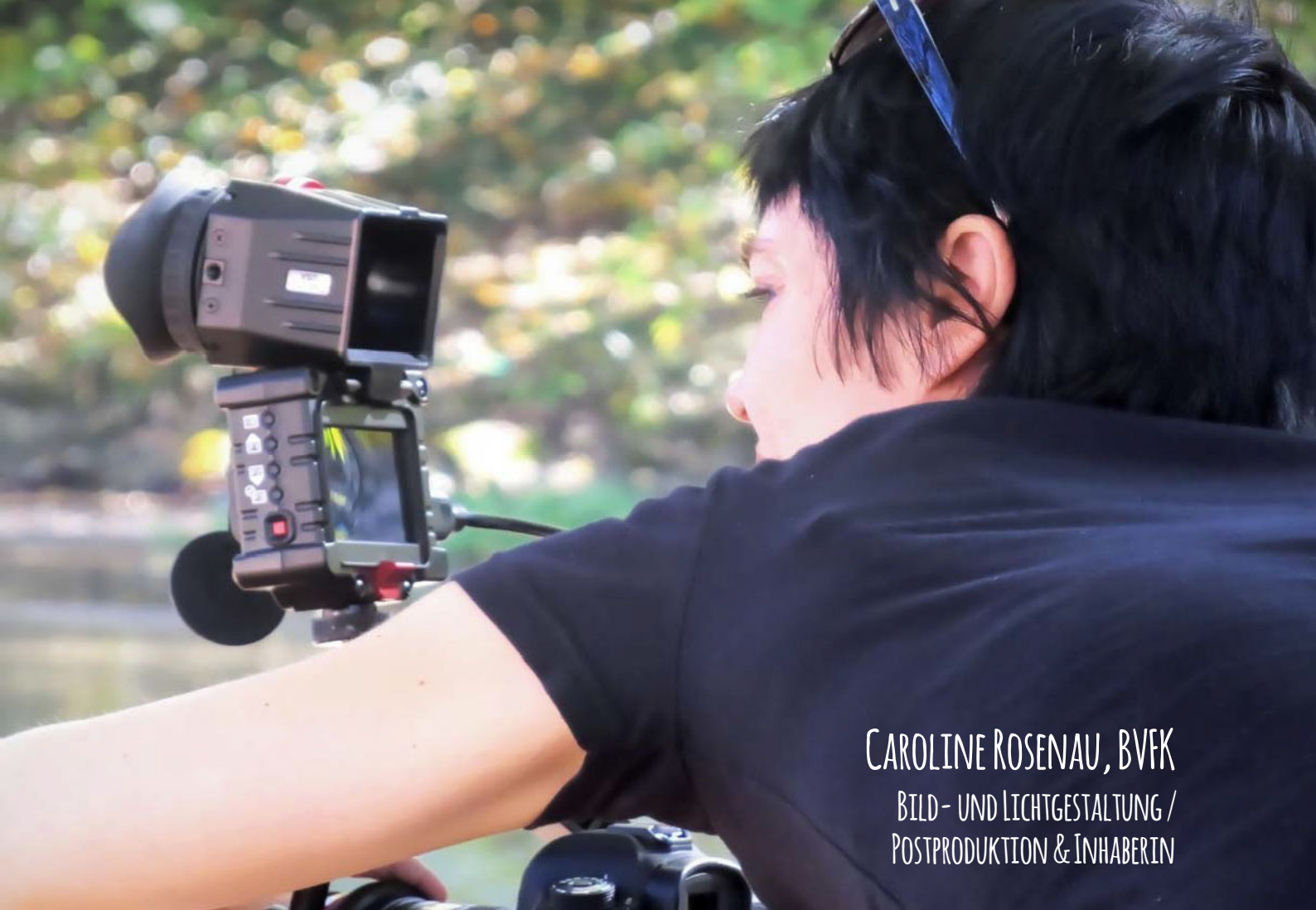
CAROLINE ROSENAU, BVFK BILD- UND LICHTGESTALTUNG / POSTPRODUKTION & INHABERIN