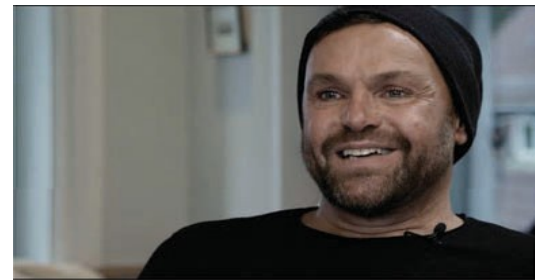
IMAGE- UND WERBEFILM - MUT, HILFE, HOFFNUNG. EIN EINBLICK IN UNSERE ARBEIT